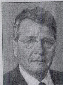
• Minister Donner

Donner (Sociale Zaken) veel te laag is. Vijf procent extra aow vanaf 66 jaar mag lekker klinken, financieel aantrekkelijk is het niet, zo blijkt uit een berekening van Kappelle. Nederlanders die voor het aow-uitstel van de