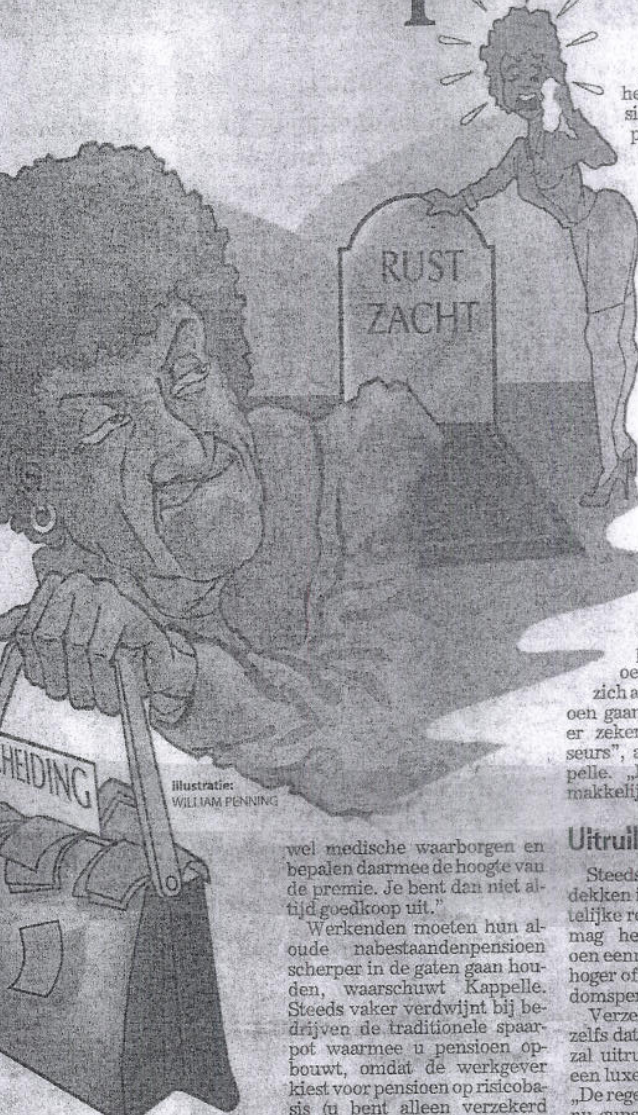
Illustratie: WILLIAM PENNING

Het is verstandig bij scheiding een adviseur te raadplegen die pensioenkennis heeft, zegt Kappelle. Elke pensioenuitvoerder mag namelijk ook eigen regels opstellen.